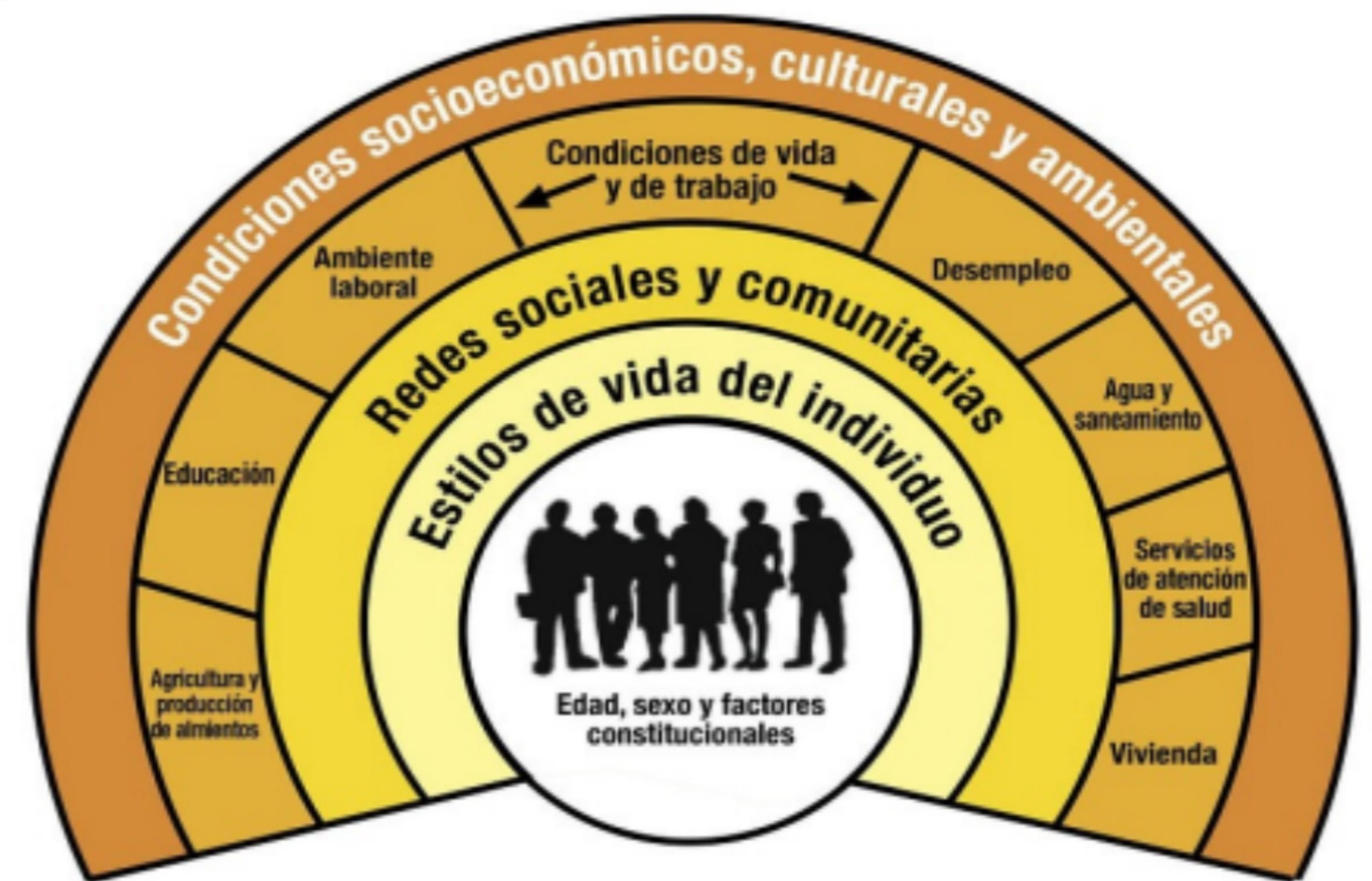
Marco de determinantes sociales de la salud de Dalghren y Whitehead (1991)

Se describen además factores desencadenantes (separación, duelo, ruptura amorosa, problemas escolares, etc.), y factores mantenedores de riesgo.