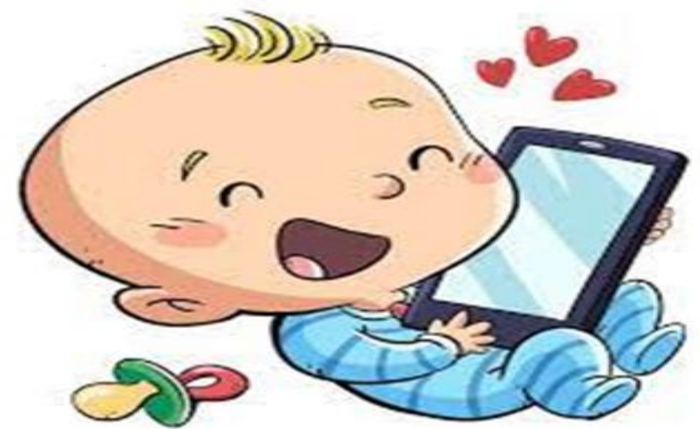
Tiempo de uso de pantallas en <6a